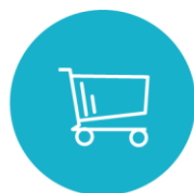
Surface de vente