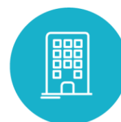
Implantation Grandes et moyennes villes