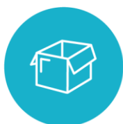
Atelier / Réserve