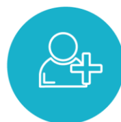
Services Conseil, Montage, SAV, Clic and Collect, Point de retrait